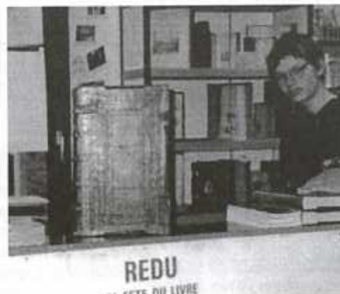
REDU ... ESTE DU LIVRE Dans le « village du livre »