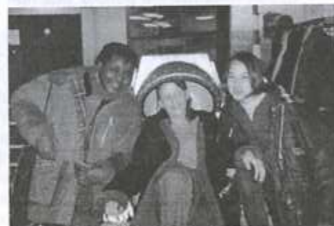
À l'Euro-Space Center