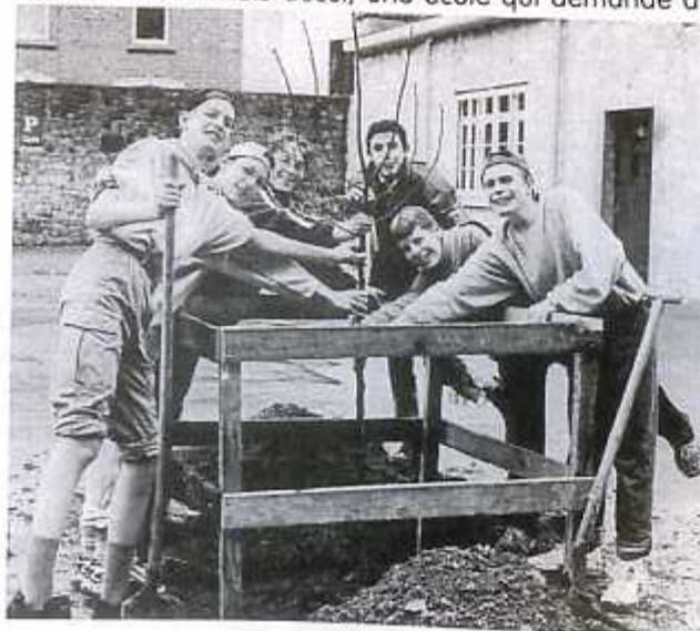
La classe de 3 e D a pris en charge la plantation de verdure dans la cour