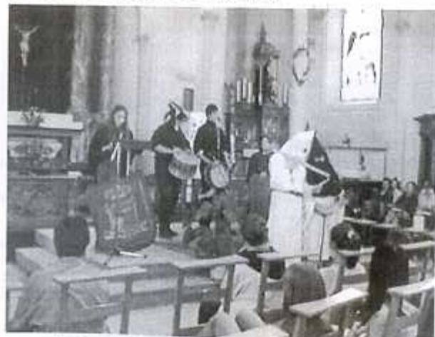
La lecture de la charte par les rhétos dans la chapelle

Il faudra donc concrétiser ces idées dans la vie de tous les jours. Mais cela, c'est une autre histoire.