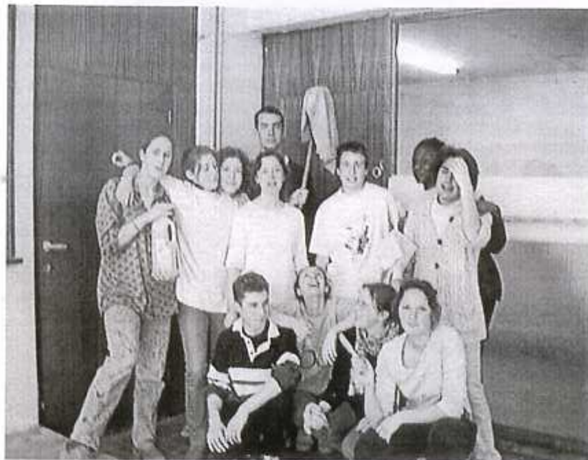
L'équipe des peintres de 5 e année a rénové le local BB5

Tout d'abord, nous nous informons . Les élèves de 6 e ont participé à un colloque « Etre citoyen aujourd'hui ». A cette occasion, ils ont rencontré -selon le sujet qu'ils avaient choisi- des personnalités de premier plan comme François Perrin, le chanoine De Locht, Ricardo Petrella, Rudy Demotte et bien d'autres. Ils sont allés puiser auprès de ces « têtes pensantes » des idées, des informations, bref, de la « matière à réfléchir » dans des domaines aussi divers que l'éthique religieuse ou scientifique, la mondialisation, la construction européenne, la lutte contre l'extrême-droite et la Belgique de demain. Ils ont ensuite, à l'école, rendu compte à leurs collègues rhétoriciens du contenu des interventions et de la réflexion induite chez eux. Une de nos élèves a même invité Ricardo Petrella à venir parler à tous les 6 e et il est venu... et a promis de revenir. On vous tiendra au courant.