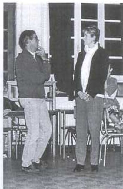
L'atelier « théâtre »