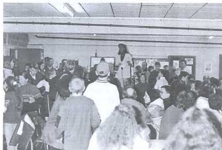
La remise des prix aux différentes équipes