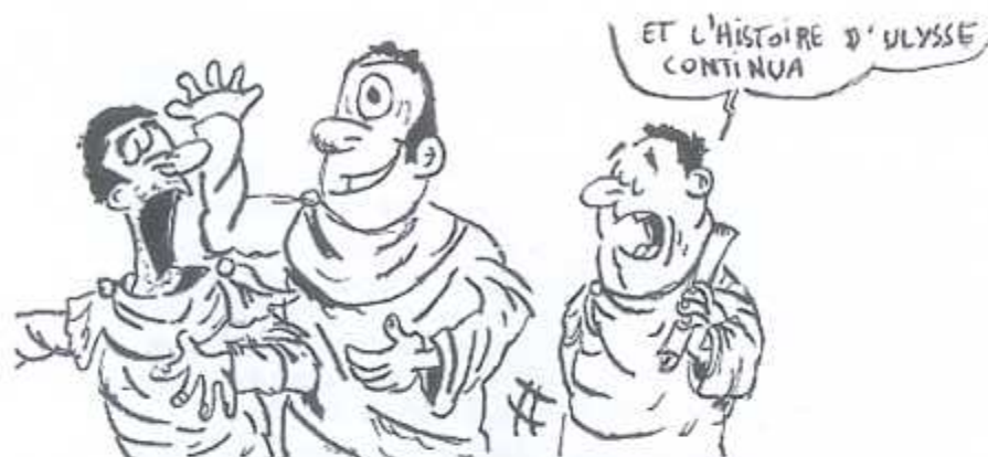
L'Odyssée sous la plume de William Riguelle (2 e année)