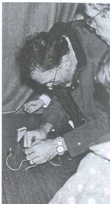
Comme au cours de technologie

Cette animation s'est déroulée dans la bonne humeur. Lors de l'évaluation de ce projet par les élèves, ils ont confié : « C'était très chouette ; on a appris à prendre la parole et à expliquer une activité à des adultes. On s'est rendu compte aussi que les parents étaient toujours de grands enfants !!! ».